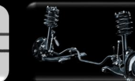
Suspensión Delantera McPherson + Barra estabilizadora