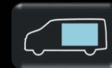
Panel de techo bajo carga hasta 6.2 M2