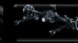
Suspensión trasera con ballestas