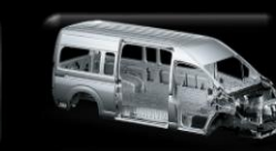
Carrocería tipo GOA