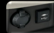
Conector de 110V