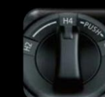
Swich de 4x4