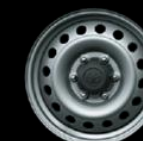
Rines 17 acero Versión MT