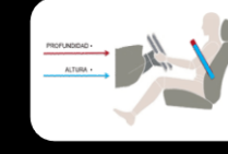
Columna de dirección Colapsable