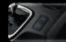
Modo ECO Versión AT