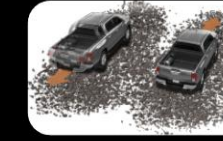
Sistema de arranque en pendientes (HAC)