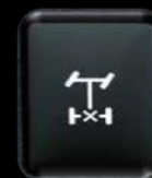
Bloqueador Dif. trasero